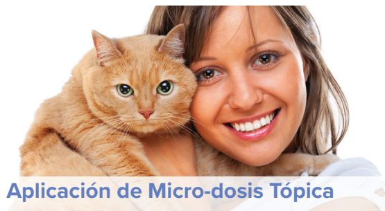
Aplicación de Micro-dosis Tópica